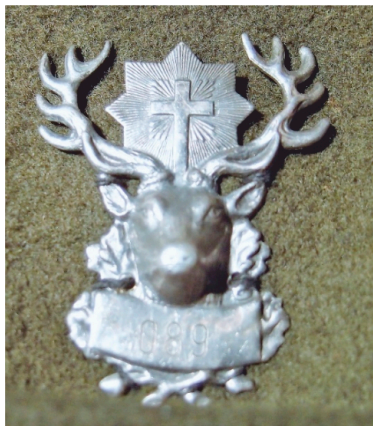
Kloboukový odznak A