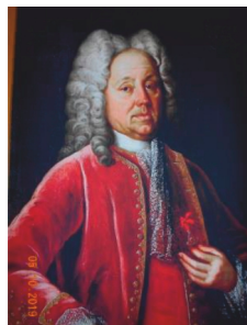
hr. Franišek Antonin Sporck