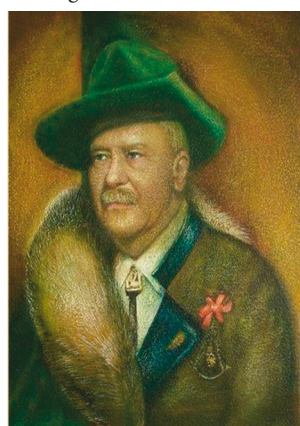
31. 3. 2007 – obecnie