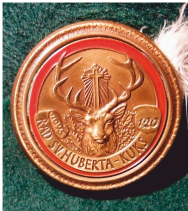
Kloboukový odznak B

Ke kolekci těchto odznaků z Výstrojního předpisu ŘsH v mezičase vznikly i jiné odznaky, např. absolventů či lektorů/komisářů kurzu o první lovecký lístek či zkoušek mysliveckých hospodářů, ke kterým má Řád svatého Huberta (se sídlem na Kuksu) pověření ministerstva zemědělství ČR. Vznikla tak verze (Richard Coufal, Brno –Žabovřesky 2018) složená z hlavy jelence běloocasého se zavěšenou loveckou trubkou (z odznaku – Řádu sv. Huberta a křížem mezi lyrovitými parohy. Tyto oba atributy se v rámci ŘsH nepoužívají).